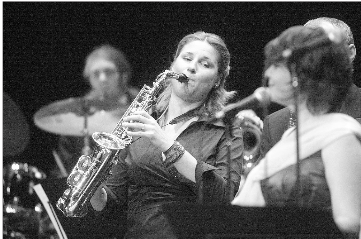
The Blue Paradise Big Band se presentará el 24 de noviembre en el Teatre Fortuny de Reus.

La siguiente cita será el martes 17 de octubre a las 20 horas, esta vez en el Teatre Metropol. Este día será el turno del violoncelista Alberto Ferrés y el pianista Miquel Villalba.