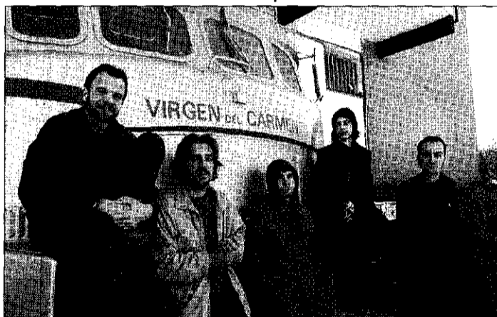
Los miembros de Pupille comienzan gira la semana próxima.

Gracias al apoyo del ayuntamiento, Cunit participa en el programa desde el año 2000.