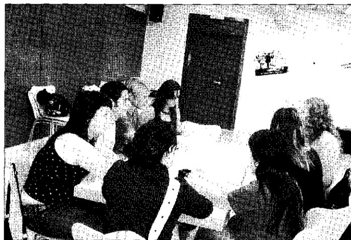
El grupo de jóvenes de Cunit preparando el viaje a Cracovia. Partieron ayer.