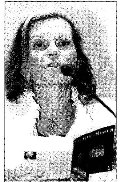
Carme Riera, ayer en la feria de Frankfurt.

La escritora mallorquina Carme Riera será esta tarde la invitada por la Associació de Dones Empresàries i Emprendedores de Tarragona para ofrecer una conferencia en la Cambra de Comerç de Tarragona a partir de las siete y media. Riera impartirá la conferencia Trencant el sostre de vidre , en la cual ofrecerá su particular impresión sobre las dificultades que tienen las mujeres para alcanzar puestos de dirección en las empresas y en las instituciones. Tras la conferencia de Riera, los asistentes al acto (abierto a todo el mundo) tendrán la oportunidad de establecer un pequeño diálogo con esta importante escritora.