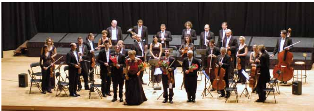
Los músicos recibieron la ovación del público en todos los conciertos de la gira.