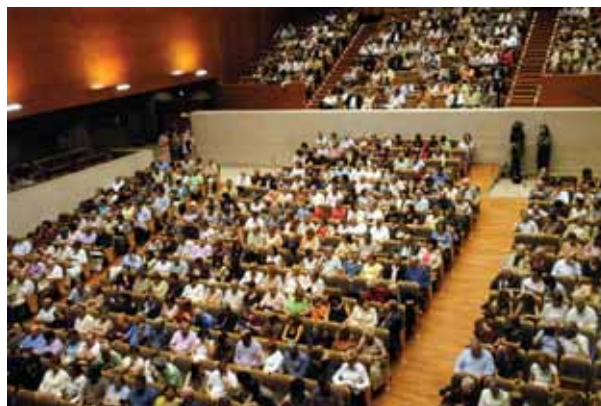
Concierto en el Auditorio Enric Granados de Lérida.

Los conciertos registraron lleno técnico en todos los auditorios, donde los músicos recibieron la ovación del público asistente.