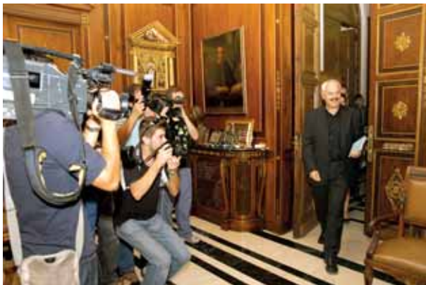
Rueda de prensa del maestro Havlicek en el Ayuntamiento de Castellón.

Los conciertos y las ruedas de prensa ofrecidas en diferentes localidades tuvieron una importante repercusión mediática en prensa, radio y televisión.