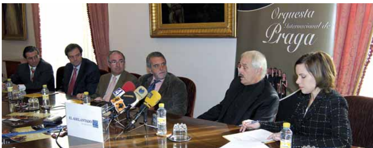
Rueda de prensa en Segovia.