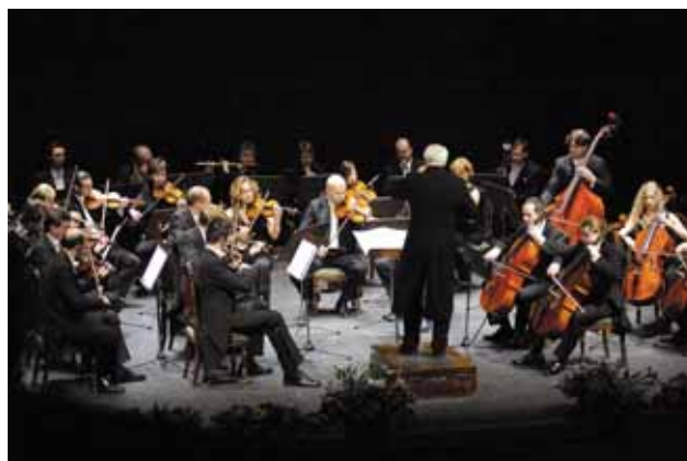
Uno de los conciertos ofrecidos por la Orquesta Internacional de Praga.

El repertorio, de corte navideño, contó con famosas óperas y obras de reconocidos compositores españoles y checos.