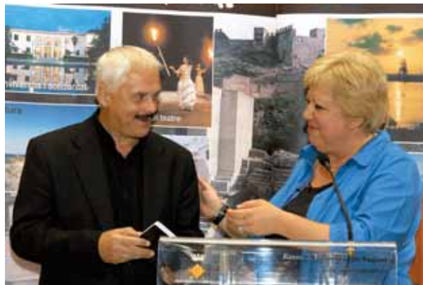
Recepción de la alcaldesa de Sagunto a la Orquesta Internacional de Praga.