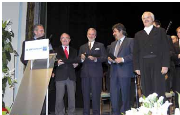
Entrega de las batutas de honor a los representantes políticos y empresariales implicados en la organización del concierto de Segovia.