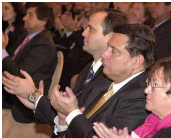
Jiri Paroubek, primer ministro de la República Checa, asistió al primer concierto de la Orquesta Internacional de Praga.

El concierto contó con la presencia de más de 100 empresarios españoles, que acudieron al Encuentro Económico, Político y Cultural España-Chequia 2005. Cabe destacar la presencia del entonces Primer Ministro del país, Jiri Paroubek, acompañado por distintas personalidades del ámbito político, social y cultural de la República