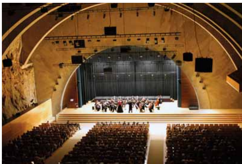
Concierto en el Palacio Ferial y de Congresos de Tarragona.